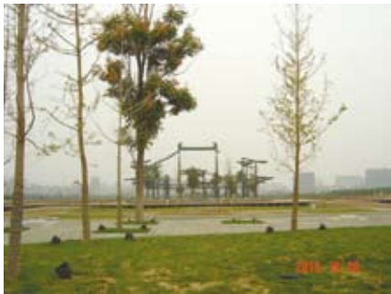
大明宮遺址

往北下了含元殿台基，就到了遺址博物館。為了不影響景觀，博物館就建在半地下。館內既有關於唐代的歷史介紹，重點則是關於大明宮的歷史和其文化上的內涵和意義。遺址博物館的東邊有個大明宮的微縮景觀，用小比例的模型，重現了大明宮當年的景觀，