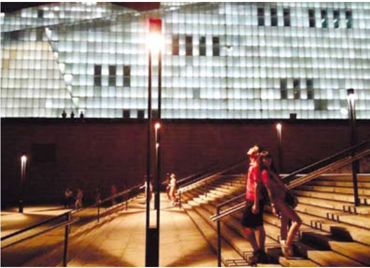
重慶大劇院一角。

國家博物館就像本千萬頁的歷史課本，記載著滿滿的歷史痕跡，隨著展示廳的順序，感受著朝代的興衰。接下來就是這座城市的主角故宮紫禁城，控制著中國500年的政權，無數清宮故事的搖籃，看著古裝劇的場景，一座座既熟悉又陌生的宮殿，這也是遊客旅遊的首要景點吧。放眼所見的瓊樓玉宇與一群群的遊客，想著皇帝的家還真夠大，當年拒洋人於千里之外的城池，現在好客的敞開大門來者不拒，美中不足就是宮殿內