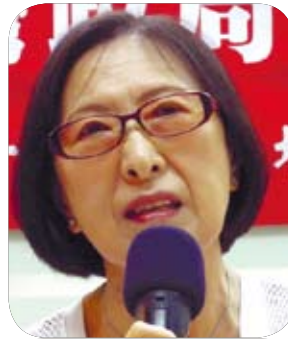
張麟徵 （台灣大學政治學系 名譽教授）