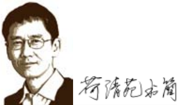
與台灣青年朋友的通信