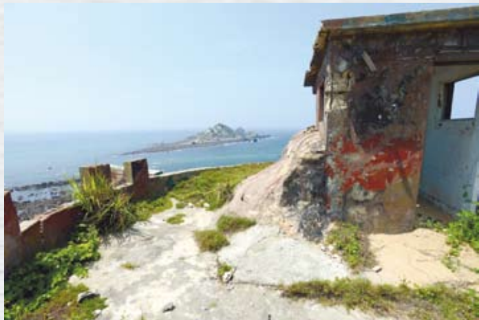
孤獨的碉堡永遠向著海

到東莒約一小時，下船立即可租車，也毋須講價。日頭曬，也懶得講。聽隔壁一家子人吵吵雜雜不知道說些什麼，但聞動黑的租車姑娘冷冷說「你講閩南話，我聽不懂」，才理解，原是這家同胞開著玩笑想講價，濃濃台灣西部一帶的海線口音碰了軟釘子。只聽到姑娘說「要偷也偷不走」。於是想起馬祖朋友幾乎不拿下車子的鑰匙，「反正上不了船」，他們說。