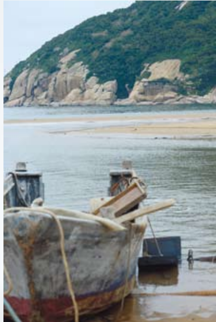
塘岐到後澳原是退潮才會出現的沙連島

回到南竿福澳港，遠遠就能瞧見山頭高掛「枕戈待旦」。另一小版的「枕戈待旦」提碑則在介壽村。上岸，環大操場一週的山