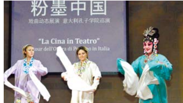
在義大利米蘭國立大學孔子學院，義大利觀眾登台向中國京劇演員學習舞袖。