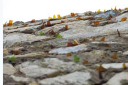
碉堡上防水鬼的碎玻璃

知名的「阿婆魚麵」就在塘岐。三兩散客，或十數人團體，幾乎都往這兒用餐。手工，沿街也賣生麵，但如多數小餐廳，老闆不見得忙得過來，故需耐心。餘下時間可以在村裡走查廢棄軍用房舍，凡極簡形式的洗