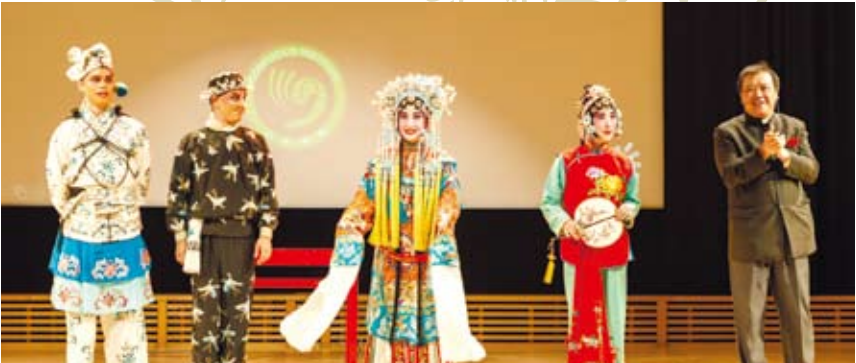
在瑞典斯德哥爾摩大學禮堂，中外京劇、昆曲演員為當地觀眾獻上精彩演出。

政、道德提升、民族融合及對文化認同有巨大積極作用。但也有學者提出，儒學已不適應今天中國的現實，等級制度已被平等制度取代，「禮制」已讓位於法治。北京大學教授張頌武認為，轉型時期的中國面臨許多問題與挑戰，比如人與自然、人與自己、人與他人、人與社會這四大關係的處理，法律調節是根本，但也有許多法律不能解決、只能靠傳統思想來調適的部分。正如習近平在孔子誕辰大會上所強調，「對傳統文化中適合於調理社會關係和鼓勵人們向上向善的內容，我們要結合時代條件加以繼承和發揚，賦予其新的涵義。希望中國和各國學者相互交流、相互切磋，把這個課題研究好，讓中國優秀傳統文化同世界各國優秀文化一道造福人類。」