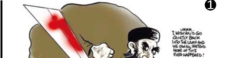
圖1（美國政治漫畫網）

圖中展示了三個印有「IRAQ」、「AFGHANISTAN」和「ISIS WAR」字樣的箱子，象徵著戰爭的連鎖反應。