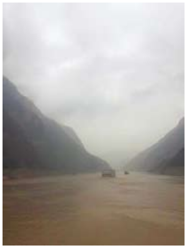
小雨中的船頭三峽景致。

我們乘著維多利亞凱蒂號繼續航行，途中壯闊的三峽景觀是我旅途中印象最深刻的畫面了，那時剛好下著