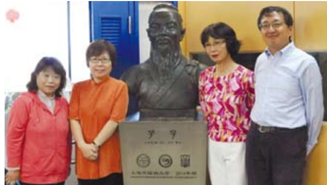
日本大阪產業大學孔子學院，日本學員與孔子像合影。